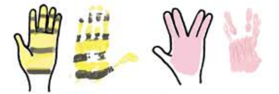
色をかえてぬってもいいね。 手のひらをぜんぶぬらなくてもいいんだよ。

クレヨンや絵のくで顔やはいけいをつけたり、まわりのものもかいたりして、絵にしてみよう