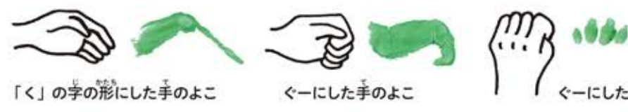
「く」の字の形にした手のよこ へーにした手のよこ へーにしたゆび