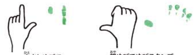
ひとさしゆびでゆびスタンプ お母ゆびでゆびスタンプ 大きさがちがうぞ