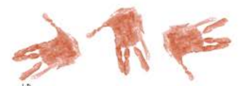
下むきにしたり、ななめにしてみたり いろんな方こうでおしてみよう。