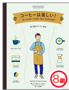
コーヒーは楽しい! 本体2,300円+税