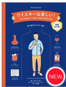
ウイスキーは楽しい! 【増補改訂版】 本体2,500円+税