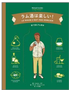
ラム酒は楽しい! 本体2,500円+税