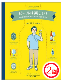
ビールは楽しい! 本体2,300円+税