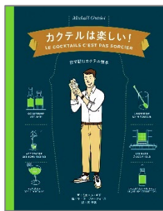
カクテルは楽しい! 本体2,500円+税